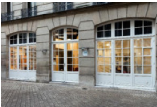
Vue cours intérieure – Espace George V