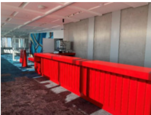
Accueil – 30 ème étage – Sky Center