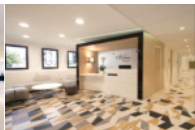
Accueil 2 ème étage - City Center - Business