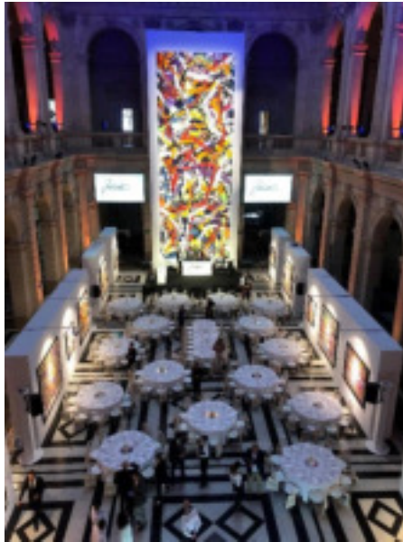
Grand hall du Palais de la Bourse