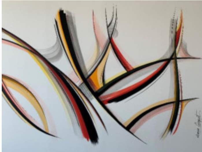
Fresque réalisée par Romain FROQUET