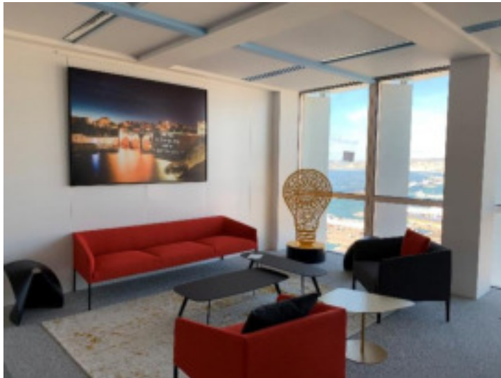
Photographie de Philippe ECHCAROUX et sculpture de Speedy GRAPHITO